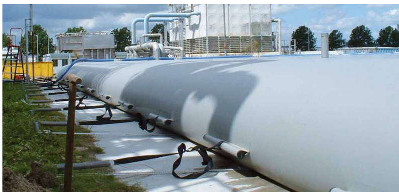
L'Alligator Bagtank est approprié aux applications industrielles.