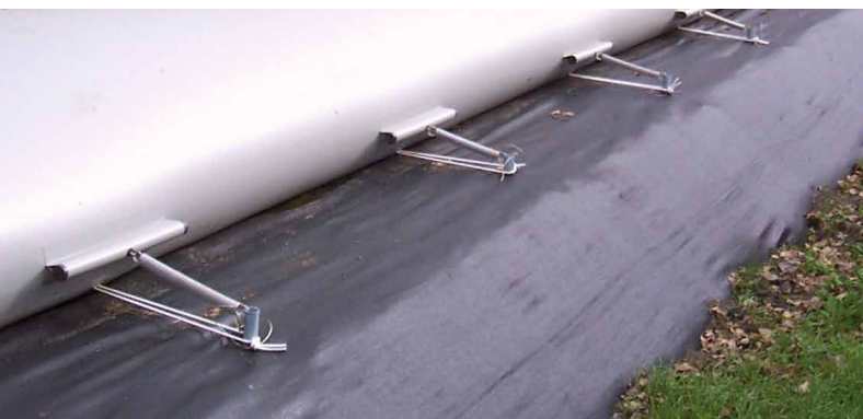
Flexible au sol permet un positionnement correct pour tous les niveaux de liquide.

Albers Alligator livre ses produits à la fois au niveau national et international, en utilisant des réseaux de revendeurs locaux. Il y a ainsi toujours un expert à proximité. Le Bagtank est utilisé dans un grand nombre de secteurs, comme l'industrie, le génie des ponts et chaussées et hydraulique et l'agriculture, la méthanisation.