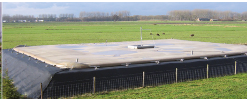
Мешок-навозосборник «Аллигатор», не нарушающий ландшафт.