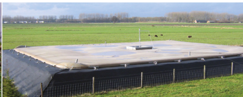
De Alligator mestzak, onopvallend in het landschap.