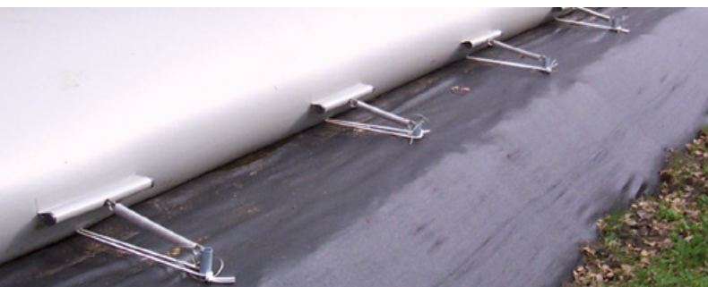
Door flexibele verankering bij elk vloeistofniveau in de juiste positie.

Albers Alligator levert haar producten zowel nationaal als internationaal. Daarbij wordt gebruik gemaakt van lokale dealernetwerken. Op deze manier is er altijd een expert in de buurt. De mestzak wordt ingezet in een groot aantal markten, zoals de industrie, grond-, weg- en waterbouw en de landbouw.