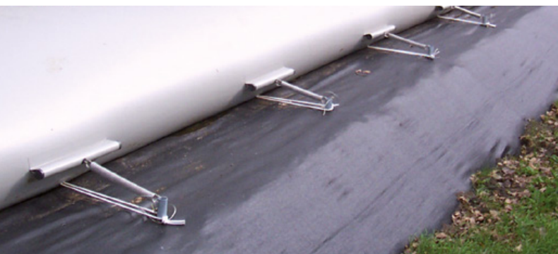
Door flexibele verankering bij elk vloeistofniveau in de juiste positie.

Albers Alligator levert haar producten zowel nationaal als internationaal. Daarbij wordt gebruik gemaakt van lokale dealernetwerken. Op deze manier is er altijd een expert in de buurt. De Bagtank wordt ingezet in een groot aantal markten, zoals de industrie, grond-, weg- en waterbouw en de landbouw.