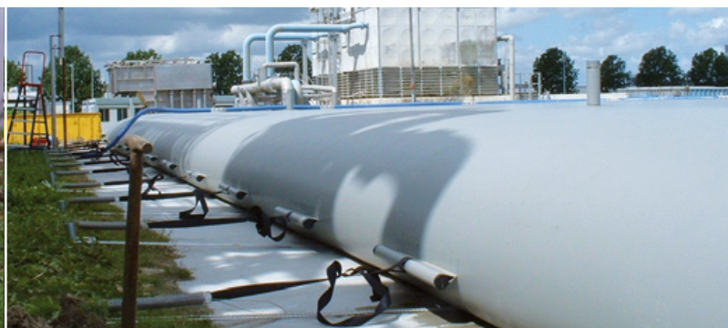
De Alligator Bagtank is geschikt voor industriële toepassingen.